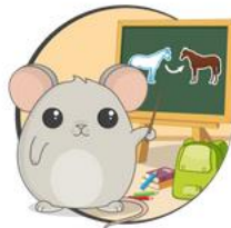
ISKOLAI ELŐKÉSZÍTŐ 1.